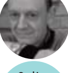
Gualtiero Oberti Architetto, Studio Oberti + Oberti Architetti